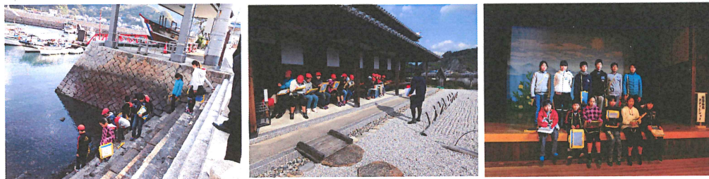
二学期終業式（12月22日）