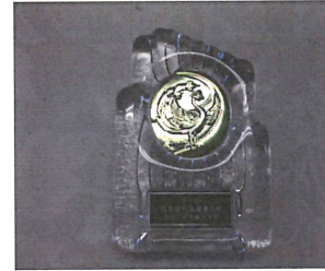
クリスタルの楯(校長室)

1月の生活目標 自分や友達のキラリをみつけよう！ 1月の保健目標 生活のリズムをととのえよう！ 「アウトメディアにちょうせんしよう」 1月の給食目標 感謝して食べよう！